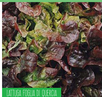
LATTUGA FOGLIA DI QUERCIA